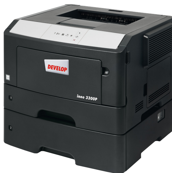
ineo 3300P az 550 lapos adagolóval (PF-P12)

Amennyiben a jelenlegi nyomtatójának, illetve azon belül is az operációs rendszerének használata túlságosan nehézkes, ideje megfontolnia, hogy ineo 3300P-re váltson. Könnyű kezelhetősége időt és energiát takaríthat meg a felhasználók számára. A felhasználóknak nem szükséges áttanulmányozniuk a használati utasítást ahhoz, hogy kezelni tudják az új nyomtatót.